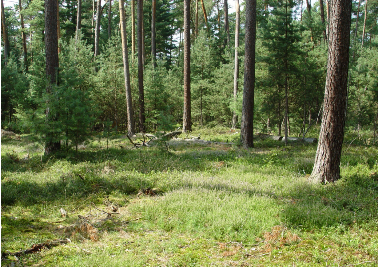
Abbildung 2: Lebensraum von Diphasiastrum zeileri in einem Kiefernwald in der Untermainebene.