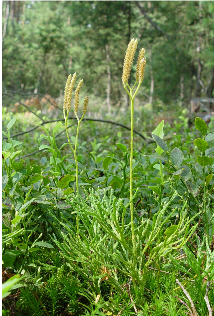
Abbildung 1: Diphasiastrum zeilleri in der Untermainebene.

Erstellt von Stefan Huck und Markus Sonnberger (2007), überarbeitete Fassung August 2009