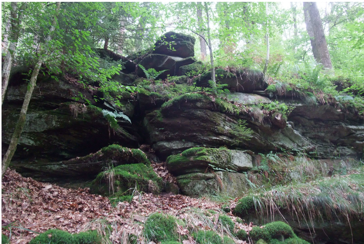
Abb. 2: Typischer Wuchsort von Trichomanes speciosum – ein beschatteter Sandsteinfelsen mit tiefen Spalten.