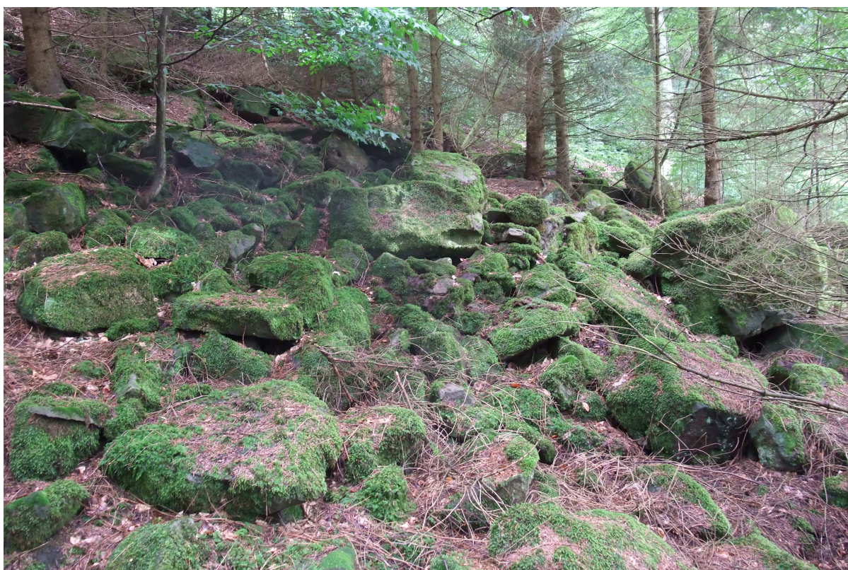
Abb. 3: Auch in beschatteten Blockhalden oder -meeren kommt Trichomanes speciosum vor.