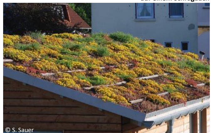
Extensive Dachbegrünung auf einem Schrägdach

Die Kosten für die Etablierung der Dachbegrünung reduzieren sich durch die verringerte Abwasserabgabe für die als teilversiegelt geltenden begrünten Dachflächen.