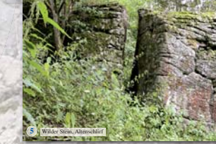
5 Wilder Stein, Altmorschiff