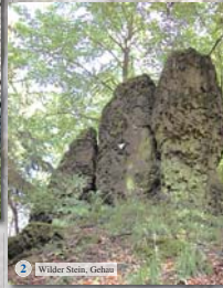
2 Wilder Stein, Gehlen