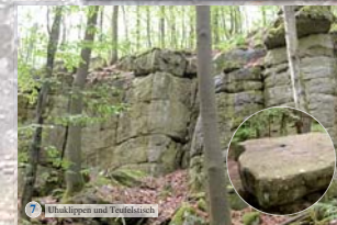
7 Eihäupten und Teufelstein