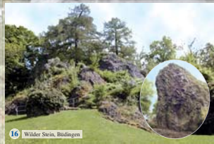
16 Wilder Stein, Badungen