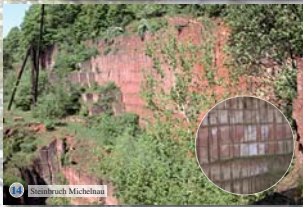
10 Steinbruch Michelham