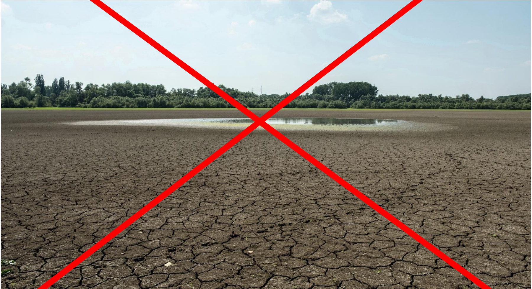
ein Altrheinarm in Südhessen, September 2018