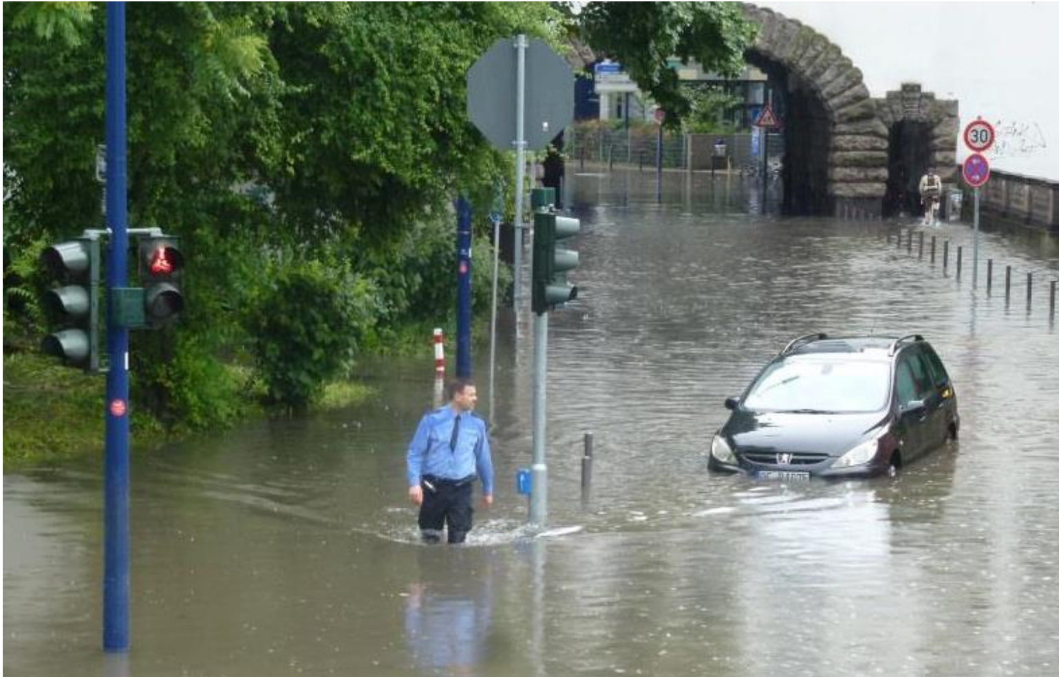
Überflutung in Offenbach 2016