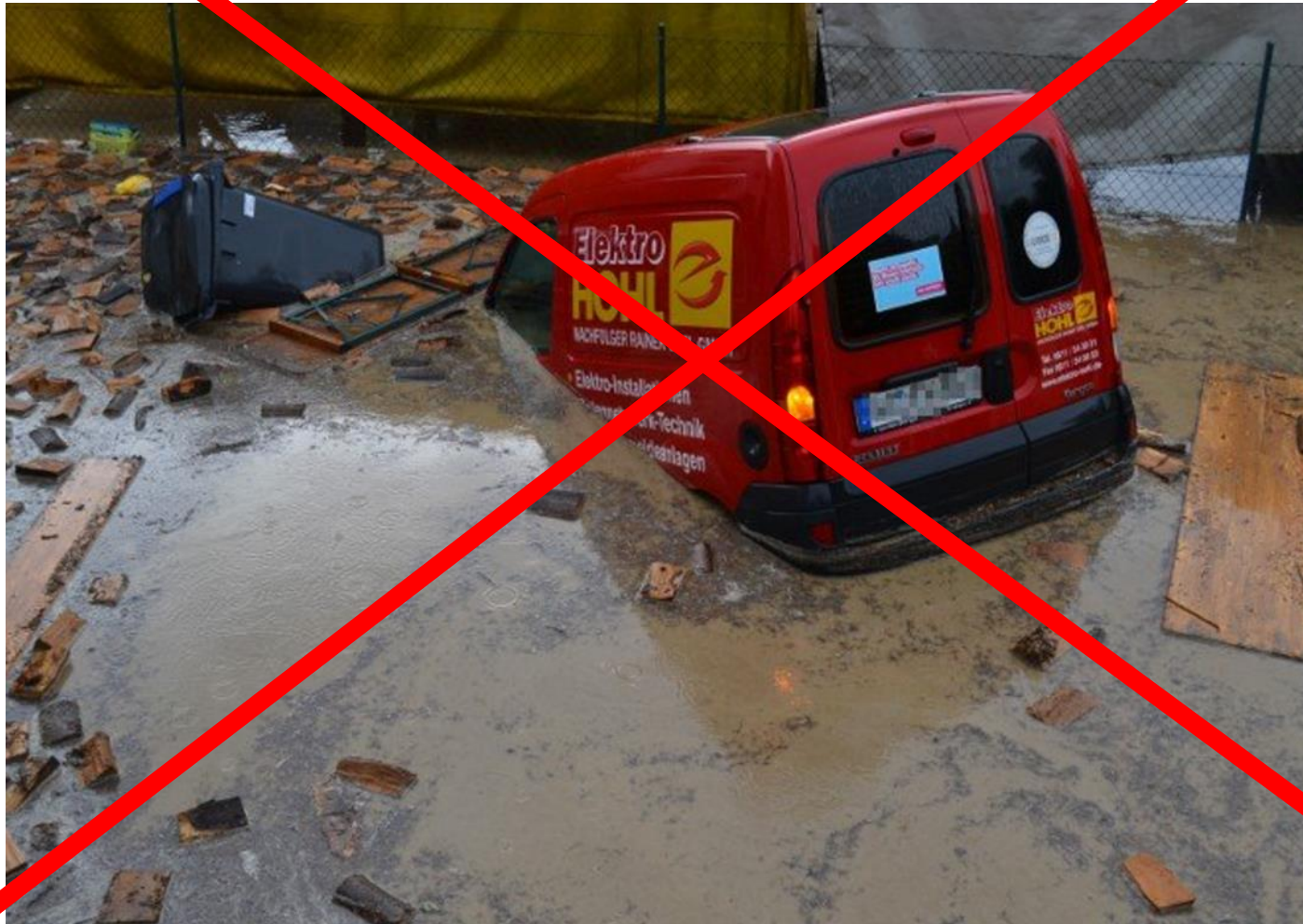
Überflutung in Wiesbaden 2014