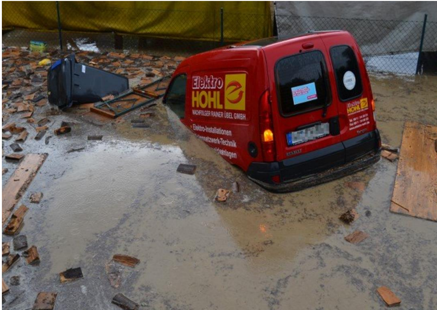
Überflutung in Wiesbaden 2014