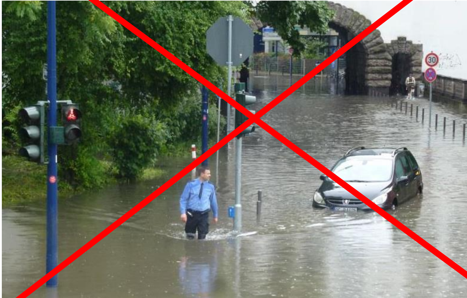
Überflutung in Offenbach 2016