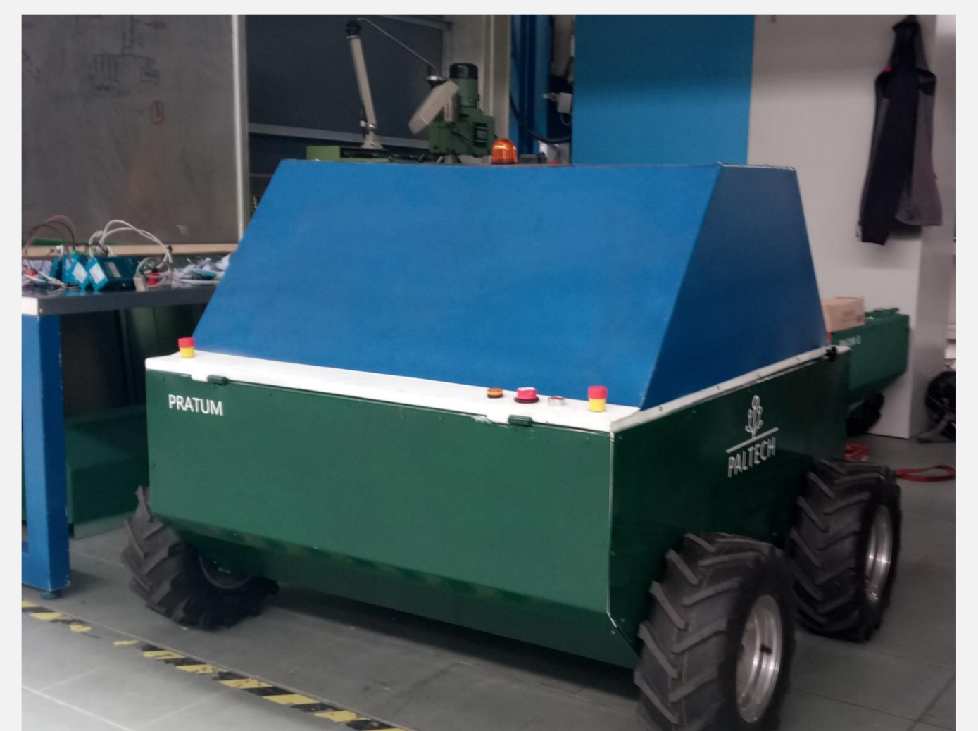
Prototyp eines Paltech Roboters

Als alternative Bekämpfungsstrategien soll die Wirkung einer moderaten Düngung mit Festmist sowie einer Beweidung erprobt werden.