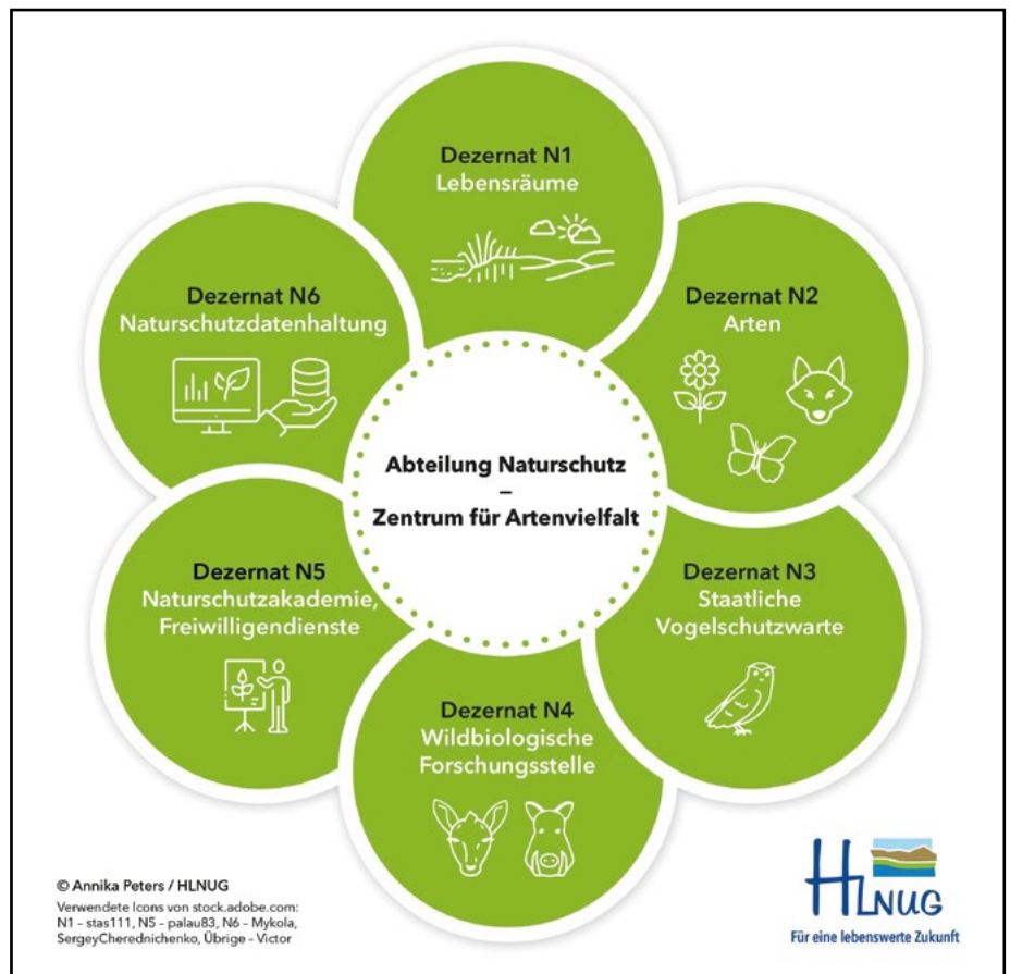
Abb. 1: Organigramm des neuen Zentrums für Artenvielfalt im Hessischen Landesamt für Naturschutz, Umwelt und Geologie (HLNUG) (Grafik: Annika Peters/HLNUG)

Eine zentrale Aufgabe des Dezernates N1 ist die Leitung und organisatorische Abwicklung der Hessischen Lebensraum- und Biotopkartierung (HLBK, Abb. 2). Diese landesweite Erfassung der Lebensraumtypen des Anhangs I der Fauna-Flora-Habitatrichtlinie (FFH-RL) und naturschutzfachlich relevanter sowie gesetzlich geschützter Biotope ermöglicht eine detaillierte Analyse der Landschaftsent-