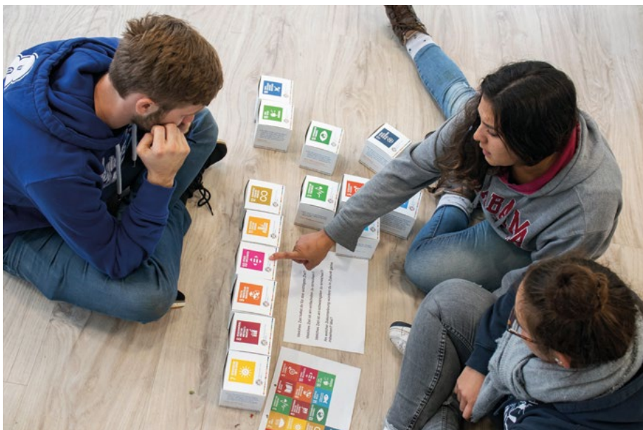
Abb. 5: Freiwillige im FÖJ beschäftigen sich mit den Nachhaltigkeitszielen der Vereinten Nationen.

sungen, Wildmanagement, Einflüsse von Schalenwild auf Ökosysteme, Wanderverhalten und Wildkrankheiten sein. Die Erforschung und Erprobung von Maßnahmen, die der Ausbreitung der Afrikanischen Schweinepest entgegenwirken, stehen ebenso auf der Agenda wie Maßnahmen zur Lebensraumverbesserung für Wildarten mit rückläufigen Bestandstrends. Aufgabe des Dezernates wird auch die Beratung der Jagd- und Veteri-