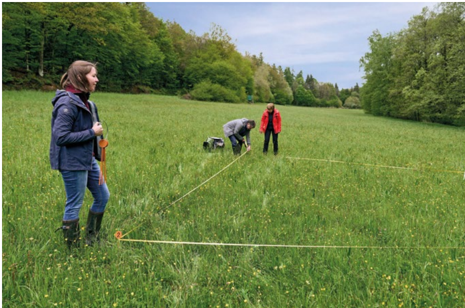
Abb. 2: Mitarbeiter/innen des Teams HLBK bei der Begutachtung einer Grünlandfläche im FFH-Gebiet „Grünland und Wälder zwischen Frankenbach und Heuchelheim“

Dezernat betreuen „Lehrgarten der Lebensräume“ am Eichhof bei Bad Hersfeld besteht die Möglichkeit, die für die hessischen FFH-Lebensraumtypen charakteristischen Pflanzenarten an einem Ort für Schulungen und Umweltbildung zu nutzen.