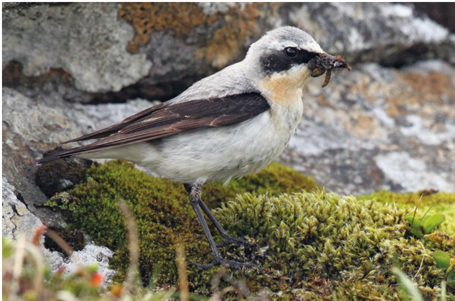
Abb. 4: Der Steinschmätzer ( Oenanthe oenanthe ) kommt als Brutvogel nur noch lokal in Hessen vor. Für die Art wurde bereits 2015 ein Artenhilfskonzept im Auftrag der Vogelschutzwarte erstellt. Durch gezielte Schutzmaßnahmen haben sich seine Bestände stabilisiert.