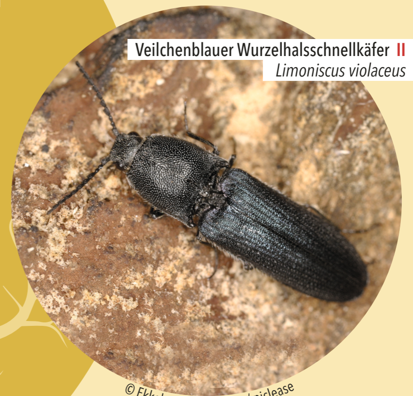
Veilchenblauer Wurzelhalsschnellkäfer II Limoniscus violaceus