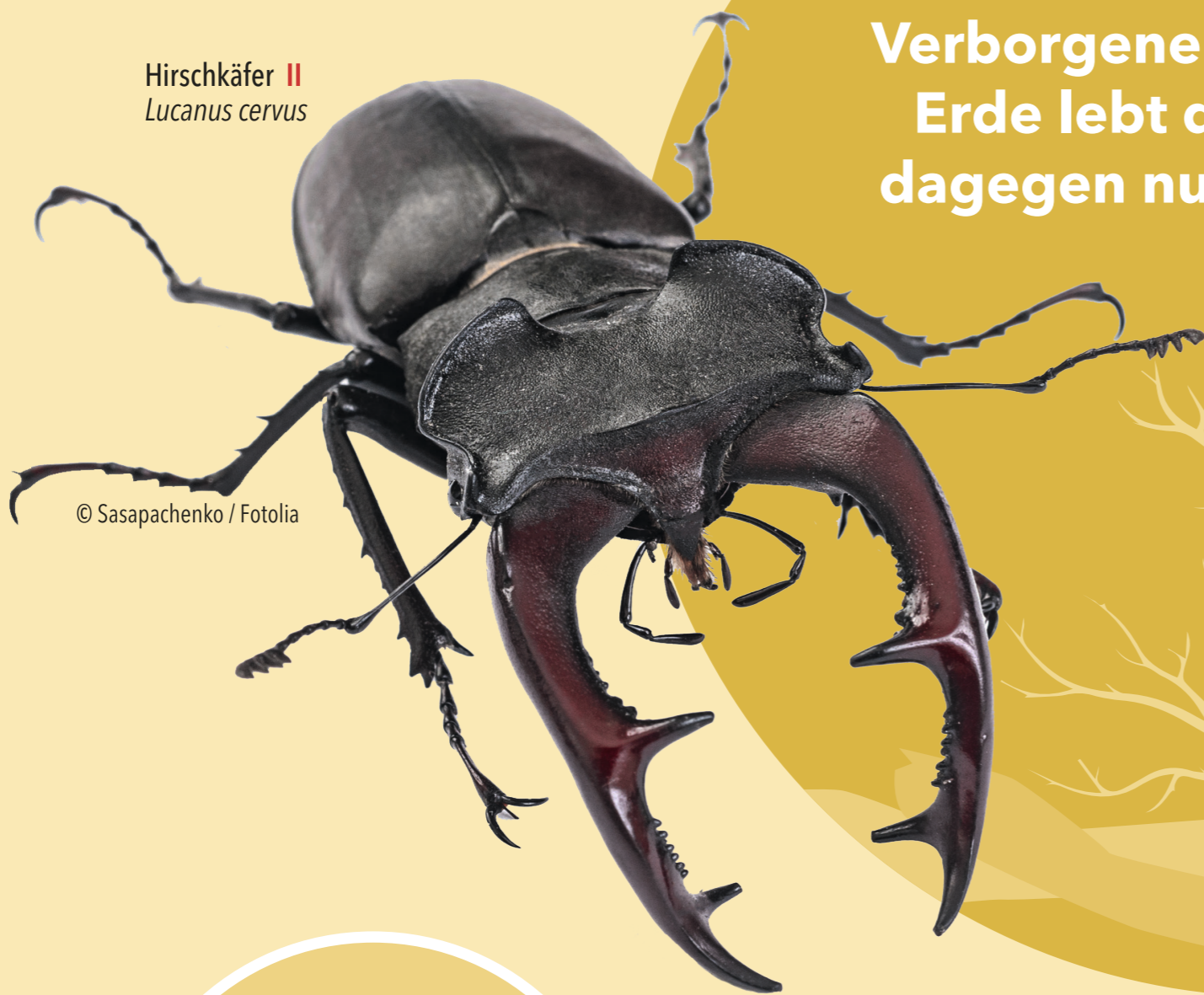
Hirschkäfer II Lucanus cervus

Die Larve des Hirschkäfers wächst bis zu 8 Jahre lang im Verborgenen heran. Über der Erde lebt der fertige Käfer dagegen nur einige Wochen.