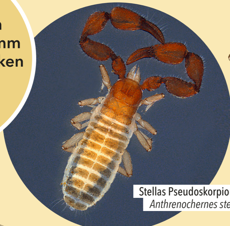
Stellas Pseudoskorpion II Anthrenochernes stellae

Der Stellas Pseudoskorpion wird nur knapp 3mm groß. Er kann Mücken und Fliegen als Transportmittel nutzen.