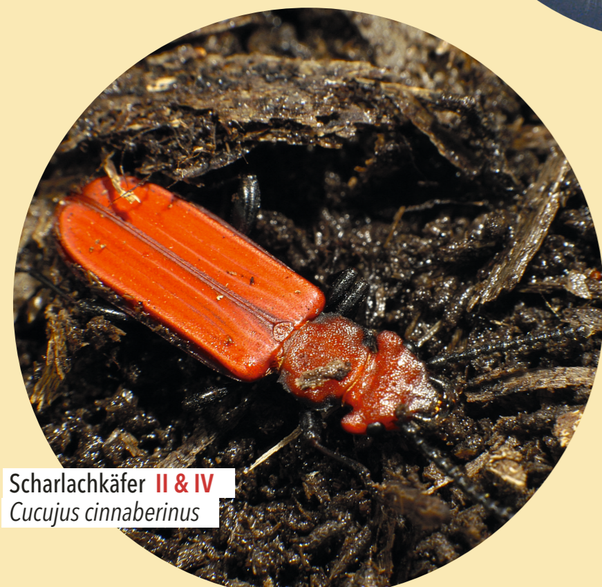
Scharlachkäfer II & IV Cucujus cinnaberinus

Die Fühler des Heldbock-Männchens werden bis zu 10cm lang. Er gehört mit 5,5cm Körperlänge zu den größten Käfern Europas.