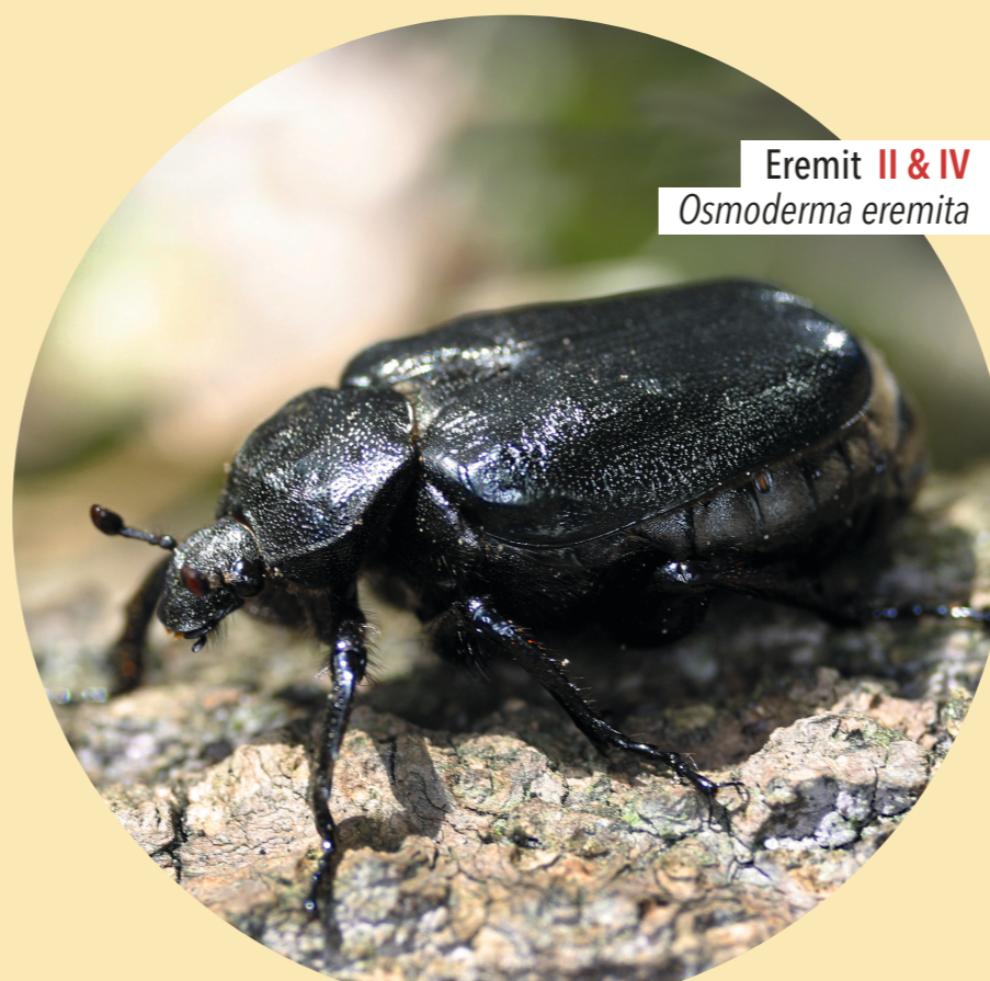
Eremit II & IV Osmoderma eremita