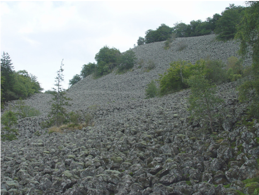
Abbildung 2: Lebensraum von Huperzia selago auf einer Basaltblockhalde am Schafstein in der Rhön.