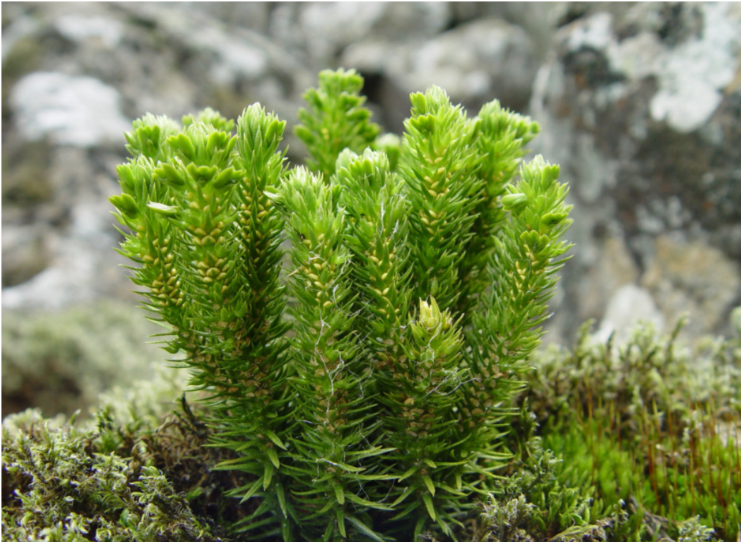
Abbildung 1: Huperzia selago auf dem Meißner.

Erstellt von Stefan Huck (2007), überarbeitete Fassung August 2009