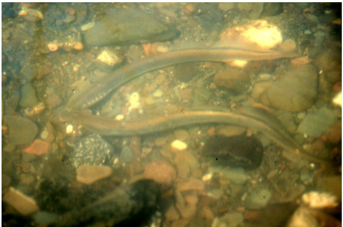
Abb. 2: Flußneunaugen beim Anlegen einer Laichgrube in der Nette, einem Rheinzufuß bei Koblenz (Rheinland-Pfalz)