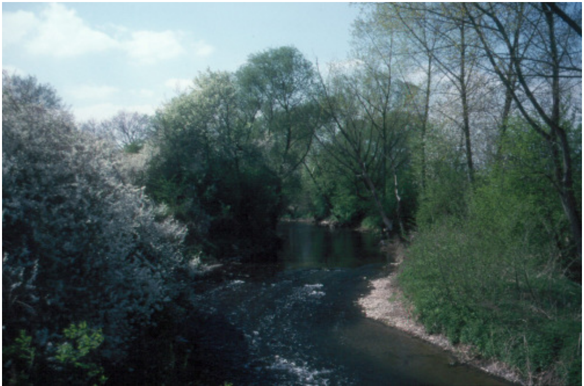
Abb. 3: Laichgebiet des Flußneunauges im Unterlauf der Nette (Rheinland-Pfalz)