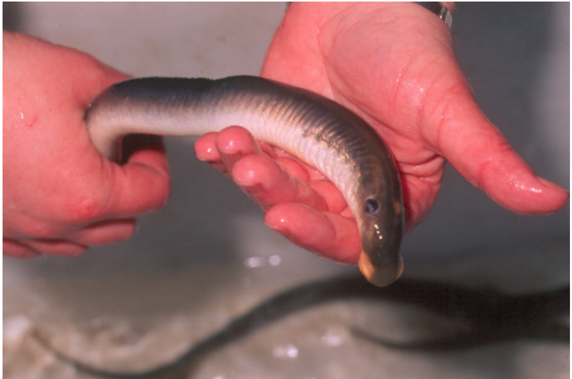
Abb. 1: Im Jahr 1996 im Mündungsbereich der Lahn nachgewiesenes Flußneunauge