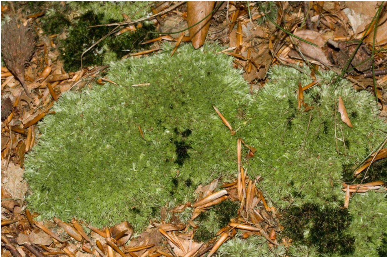
Abb. 1. Leucobryum glaucum auf Waldboden im Kranichsteiner Forst bei Darmstadt

Erstellt von U. Drehwald, D. Teuber & T. Wolf (2010)