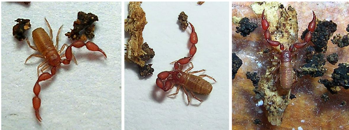
Abb.1: Anthrenochernes stellae