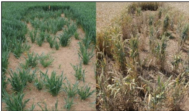
Etabliertes Lerchenfenster im Mai (links) und Juli (rechts) im Getreide.