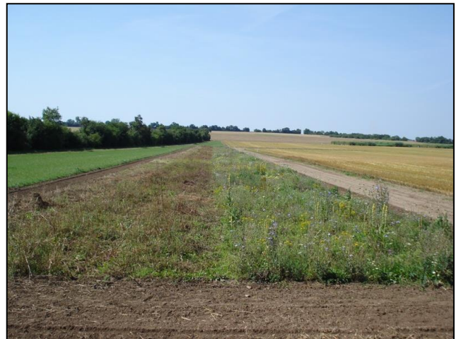
Anlage eines Blühstreifens, mit Verlängerung des Blühaspektes in den Spätsommer, durch Schröpfschnitt. Schwarzbrache links außen angrenzen.