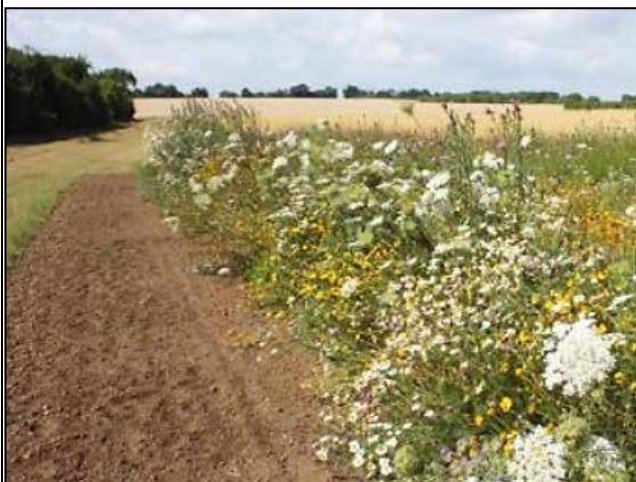
Foto: Sandra Mann; Anlage eines Blühstreifens. Quelle: Ministerium für Landwirtschaft und Umwelt des Landes Sachsen-Anhalt. In: Blühstreifenbroschüre (FENCHEL et al. 2015).