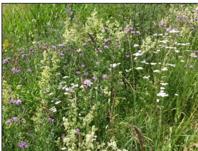
Blühstreifen mit hoher Artenvielfalt (u.a. Wilde Karde, Scharfgabe, Flockenblume, Wiesen-Labkraut) in der Wetterau (Ausgleichsflächen Hof Grass).

Generell ungeeignet zur Anlage von Bunt- und Schwarzbrachestreifen sind beschattete und dauerhaft nasse Standorte. Außerdem sollten die ausgewählten Flächen frei von mehrjährigen Problemarten wie z.B. Ackerkratzdistel oder Quecke sein. Je breiter die Blühstreifen sind, desto mehr Schutz bieten sie vor Prädatoren.