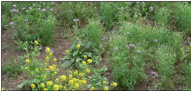
Foto: Frisch ausgesäter Teil; viele offenere Bereiche für Küken nutzbar.

u.a. keine Förderung/Teilnahme von Flächen in Naturschutz- und Wasserschutzgebieten