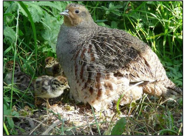
Henne mit Küken (Foto: Eckhard Gottschalk).