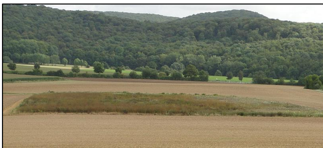
Mittig im Feld platzierte Blühfläche. (Archiv Rebhuhnprojekt Göttingen: BEEKE & GOTTSCHALK).