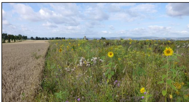
Foto: Artenreicher Blühstreifen mit angrenzendem Getreide (Archiv Rebhuhnprojekt Göttingen: BEEKE & GOTTSCHALK).